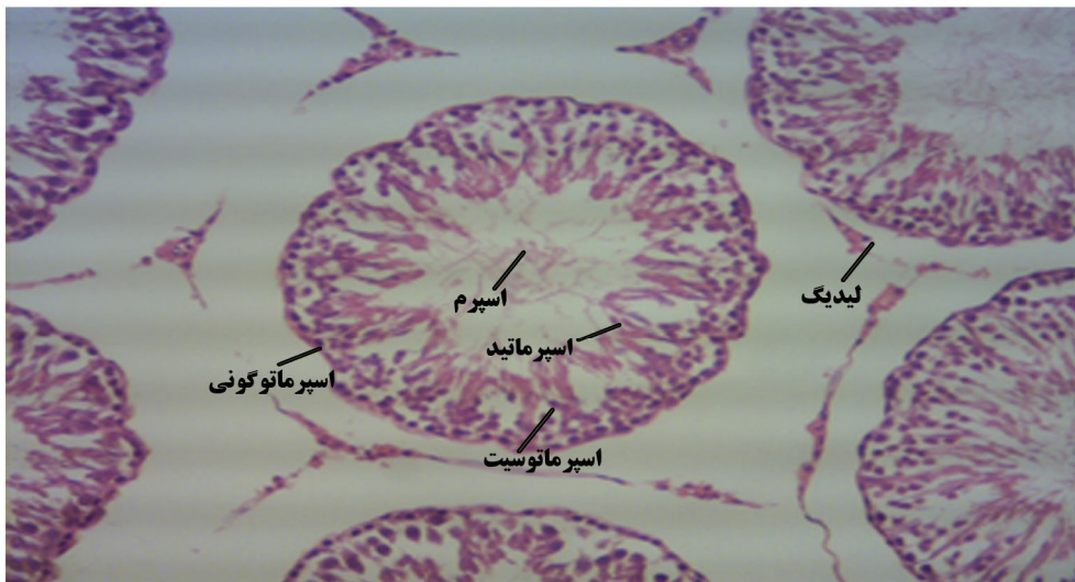
تصویر ۳: فتو میکروگراف بافت بیضه در گروه تجربی ۳ با دوز ۲۰۰ میلی‌گرم بر کیلوگرم (رنگ آمیزی هماتوکسیلین - ائوزین، میکروسکوپ نوری، بزرگنمایی ۴۰ X)