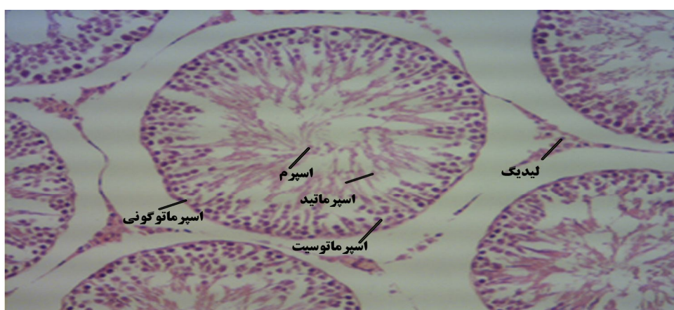
تصویر ۱: فتو میکروگراف بافت بیضه در گروه کنترل (رنگ‌آمیزی هماتوکسیلین - ائوزین، میکروسکوپ نوری، بزرگنمایی X ۴۰)

* اختلاف معنی‌دار با گروه‌های کنترل و شاهد ( P < 0.05 )