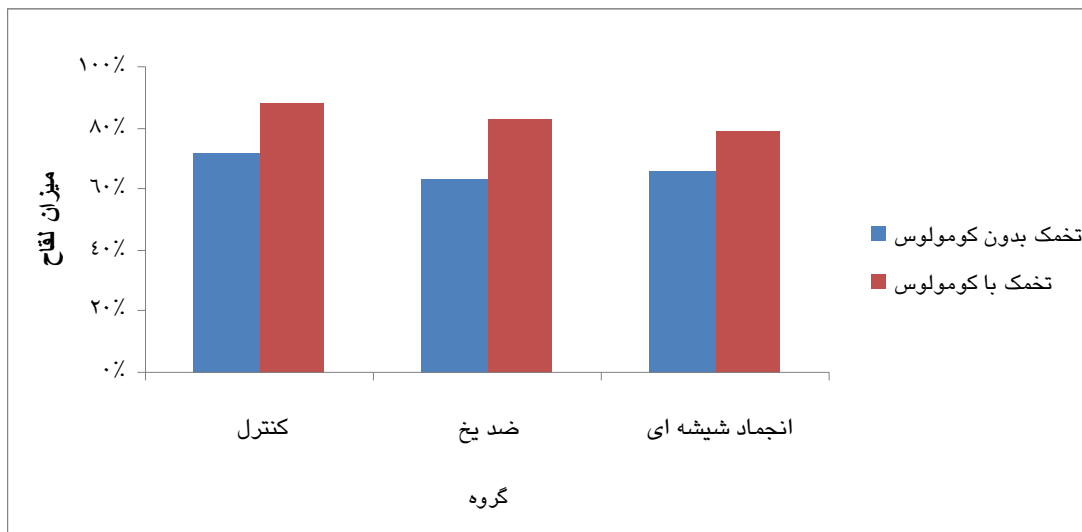
نمودار ۳: مقایسه میزان لقاح تخمک‌های ژرمینال وزیکول با و بدون کومولوس در گروه‌های کنترل و مداخله