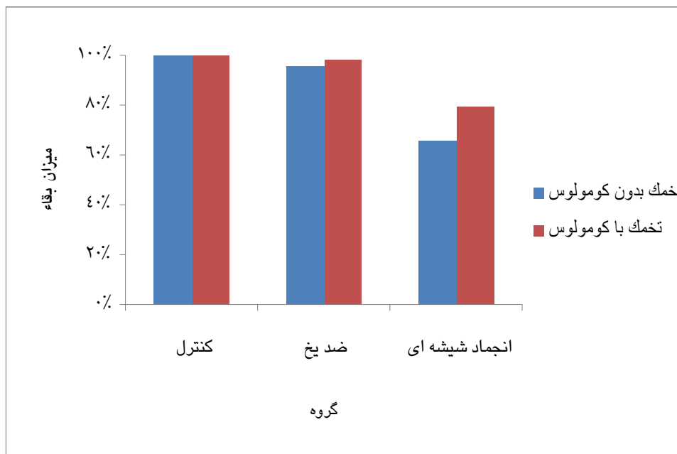
نمودار ۱: مقایسه میزان بقاء تخمک‌های ژرمینال و زیکول با و بدون سلول کومولوس در گروه های کنترل و مداخله