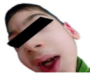
تصویر ۱: نقص در تکامل