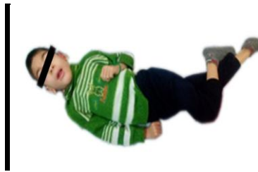
تصویر ۳: ضایعات مغزی