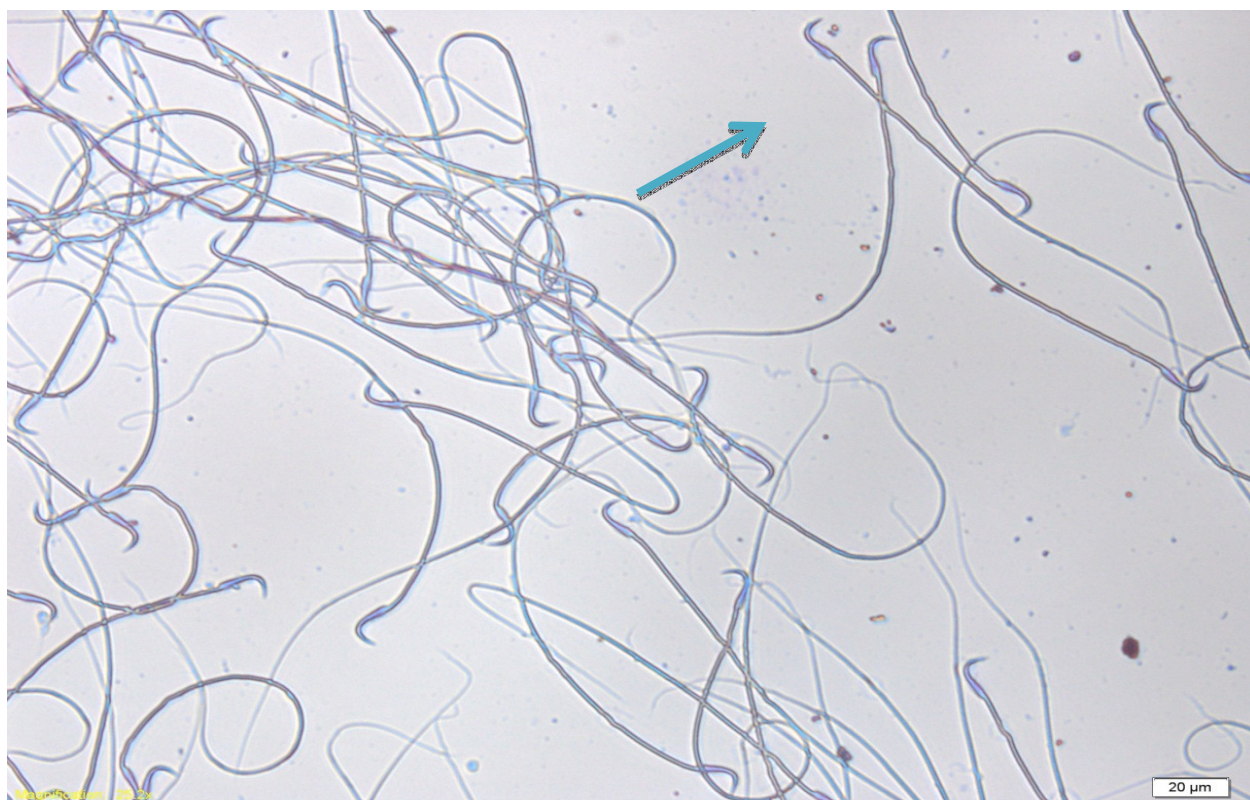
تصویر ۲: شکست DNA مشاهده شده در گروه ۵ (۴ ساعت و با فاصله ۳۰ سانتی متر از مودم)