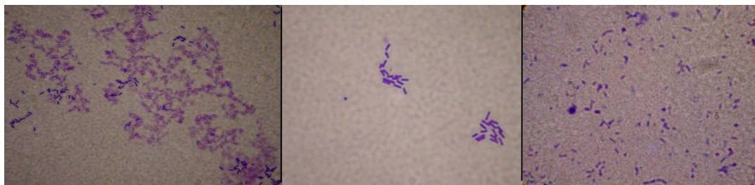
(الف) (ب) (پ)

تصویر ۱: اتصال (لام ۴ ساعته)، (ب) تشکیل میکروکلنی (لام ۱۶ ساعته) و (پ) تشکیل بیوفیلم بالغ باکتری لیستریا مونوسیتوژنز (لام ۲۰ ساعته) بر روی سطح