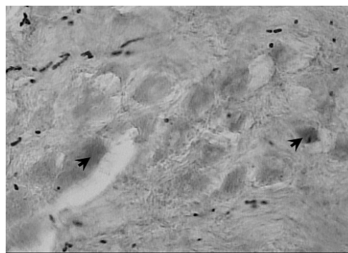
تصویر ۱: سلول‌های نشان‌دار شده با پراکسیداز هورس رادیش در مقاطع گروه شاهد در واکنش با دی‌آمینوبنزیدین (رنگ‌آمیزی زمینه با تیونین، بزرگنمایی ۴۰۰ میکروسکوپ نوری)

شاهد ۴-۲ سلول در هر مقطع و متوسط سلول‌های نشان‌دار شده ۳ سلول مشاهده شد(تصویر ۱). در گروه آزمون ۸-۴ سلول در هر مقطع و متوسط سلول‌های نشان‌دار شده به وسیله ردیاب ۶ سلول در هر مقطع وجود داشت که تفاوت آماری معنی‌داری نسبت به گروه شاهد دارد(تصویر ۲) ( P < 0.05 ). کیفیت ماده رنگی دی‌آمینوبنزیدین و رسوب آن در بافت‌های گروه آزمون نسبت به گروه شاهد بیشتر بوده و مشاهده سلول حاوی ماده رنگی دی‌آمینوبنزیدین آسان‌تر می‌باشد(تصویر ۲).