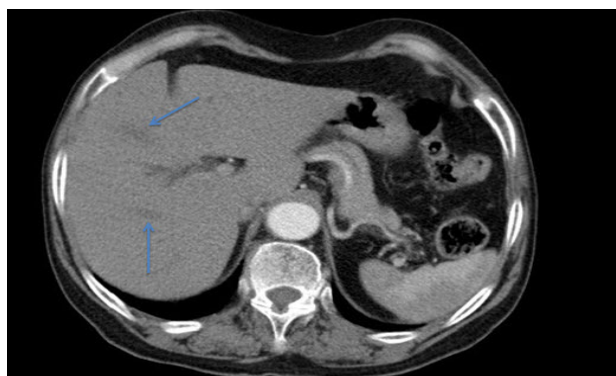
شکل ۱: نمای CT Scan کبد بیمار. فلش‌ها ضایعه کبدی را نشان می‌دهند