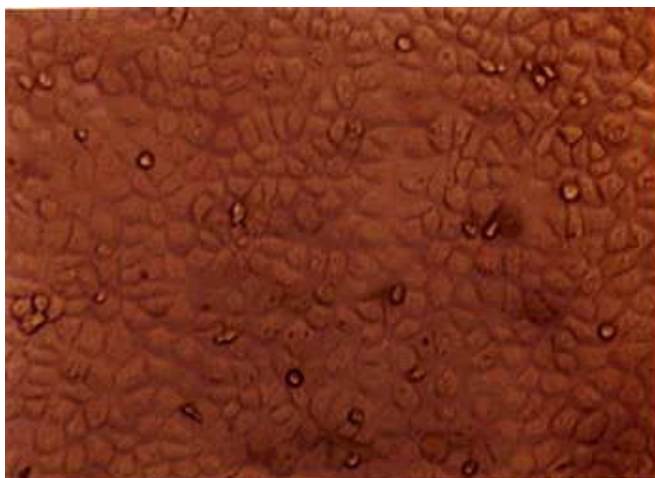
تصویر ۱: تک لایه سلول کلیه گاو. همان طور که مشخص است این سلول‌ها به صورت تک لایه چسبیده رشد می‌کنند و ظاهری اپی‌تلیالی دارند. (بزرگنمایی ۲۰۰ از فلاسک کشت سلول بدون رنگ آمیزی با استفاده از میکروسکوپ معکوس دوربین‌دار).

بعد، به منظور خالص‌سازی ویروس از دو مرحله آزمایش رقت‌سازی متوالی و سپس روش پلاک استفاده شد. در هر دو مرحله آزمایش رقت‌سازی متوالی ظهور آثار سیتوپاتیک بررسی گردید و آخرین رقتی که آثار در آن ظاهر شد، لوله رقت ویروسی 10^{-5/5} بود. از این ویروس به عنوان بذر ویروس در خالص‌سازی با روش پلاک استفاده گردید. همان طور که در تصویر ۳ مشاهده می‌شود، پلاک ویروسی به صورت ناحیه بی‌رنگ در زمینه سلول‌های رنگ گرفته