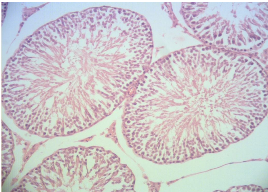
تصویر ۲: مقطع بافت‌شناسی بافت بیضه در گروه دریافت کننده حداکثر گوشت میوه کدو تنبل (۸۰ درصد) (رنگ‌آمیزی هماتوکسیلین-ائوزین، میکروسکوپ نوری، بزرگ‌نمایی \times 40 )