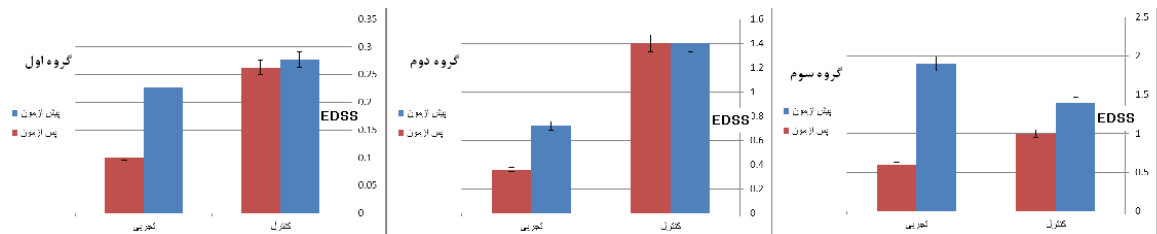
نمودار ۲: تغییرات PCI در گروه اول (EDSS کمتر از ۴/۵)، گروه دوم (EDSS بین ۴/۵-۵/۵) و گروه سوم (EDSS بیشتر از ۶)