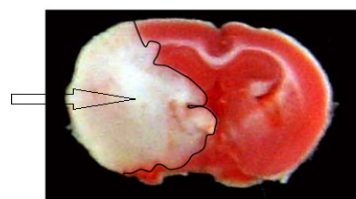
تصویر ۱: اندازه‌گیری میزان ضایعه مغزی با استفاده از نرم‌افزار ImageTools را نشان می‌دهد.

گرفت. ارزیابی حجم آسیب بافتی به این صورت انجام شد، ۲۴ ساعت بعد از القای ایسکمی حیوانات تحت بیهوشی عمیق با داروی کلرال هیدرات به میزان ۸۰۰ میلی‌گرم بر کیلوگرم کشته شده و مغزها به دقت خارج شدند و در دمای ۴ درجه سانتی‌گراد به مدت ۵ دقیقه در سالیین سرد قرار گرفتند. سپس، مغز موش‌های صحرایی در ماتریکس مغز قرار گرفت و به طور کروئال به مقاطع ۲ میلی‌متر برش داده شدند. این مغزها به مدت ۱۵ دقیقه در محلول ۲ درصد ۲،۳،۵-تری فنیل تترازولیوم کلراید (TTC شرکت مرک آلمان) در دمای ۳۷ درجه سلیسیوس برای رنگ‌آمیزی حیاتی انکوبه شدند. از برش‌ها با استفاده از دوربین دیجیتال قابل اتصال به کامپیوتر عکس‌برداری شد. مساحت ناحیه آسیب دیده (مناطق که رنگ نمی‌گرفت) هر برش با استفاده از نرم‌افزار Uthsca Image Tools اندازه‌گیری شد و با ضرب کردن مساحت‌های مذکور در ضخامت ۲ میلی‌متر و جمع اعداد حاصل از ۷ برش حجم ناحیه آسیب بافتی محاسبه شد (۲۶).